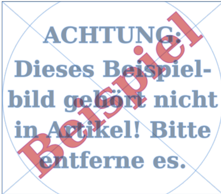
Abbildung 1: Hier könnte ihre Werbung stehen