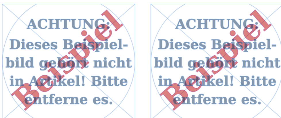
Abbildung 2: Beispiel mit Minipage