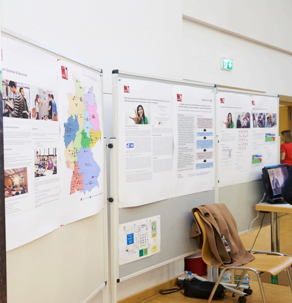
Fakultät Interdisziplinäre Studien