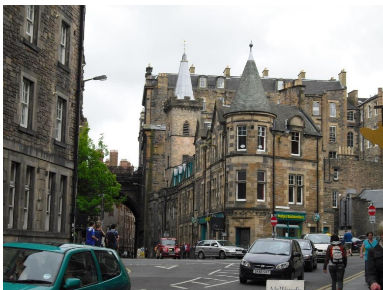
Das Hostel der Gruppe in Edinburgh.